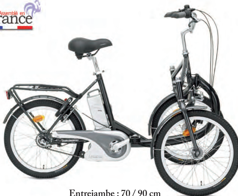
Entrejambe : 70 / 90 cm